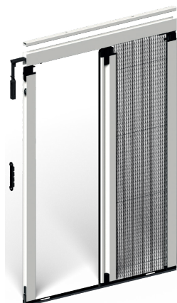
PLISSÉE LATÉRALE 0.18