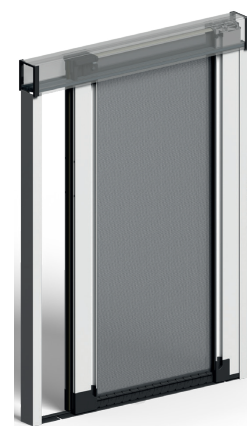
LATÉRALE AVEC CHARIOT ACCES LIBRE