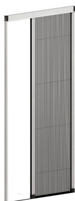
PLISSÉE LATÉRALE 0.40